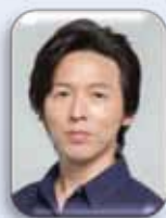
脚本・総合演出 山縣有斗